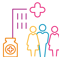
Matibabu, Utunzaji na Msaada