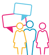
Haki za Binadamu na Haki ya Jamii

Ajenda hii ya Utetezi imejikita katika maeneo makuu manne: